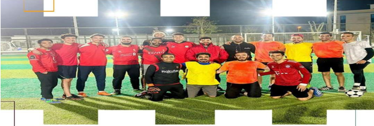
الدورة الرمضانية لكليات جامعة دراية